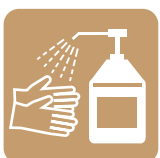
Use Hand Sanitizer