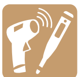
Take Your Temperature