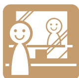
Use Acrylic partition