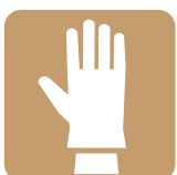
Use Gloves on the situation